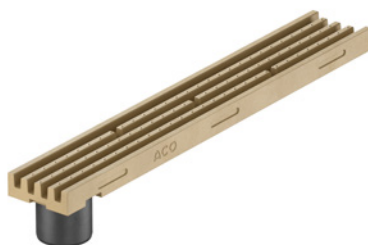
Kanał 1 m z króćcem naturalny