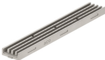
Kanał 1 m szary