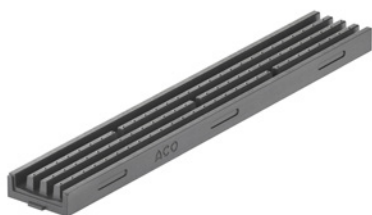
Kanał 1 m antracytowy