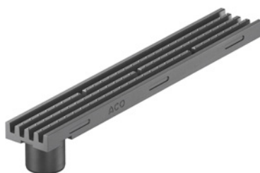
Kanał 1 m z króćcem antracytowy