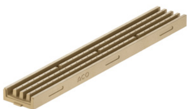
Kanał 1 m naturalny