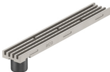
Kanał 1 m z króćcem szary